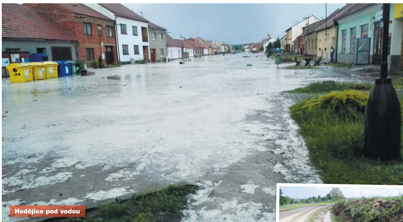
Hodějice pod vodou

V pátek 27. května ve večerních hodinách se prohnala naší obcí bouřka, která trvala sice jen asi 45 minut, ale spadlo během ní 74 mm srážek a způsobila značné škody. Průtrž mračen splavila z okolních polí do obce bláto, přetekl i suchý poldr. Záplava zasáhla na 60 domů, došlo k zaplavení některých sklepů, studní, v některých případech i obytných místností. Od pátečního večera po celý víkend pomáhali s likvidací škod