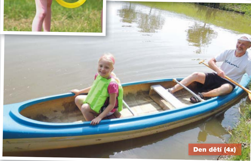
Den dětí (4x)