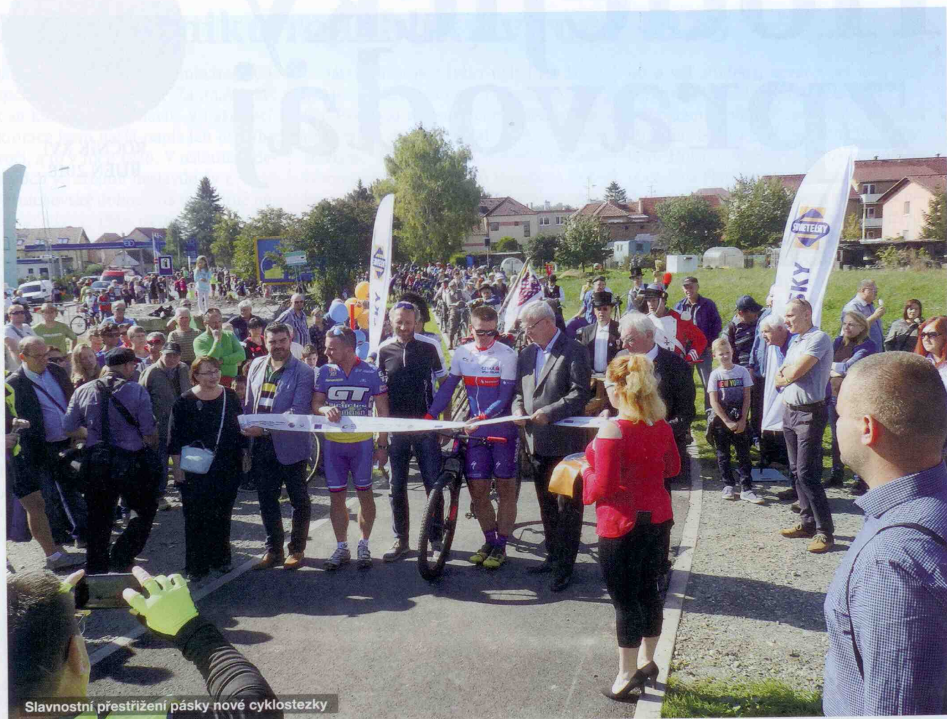
Slavnostní přestřižení pásky nové cyklostezky