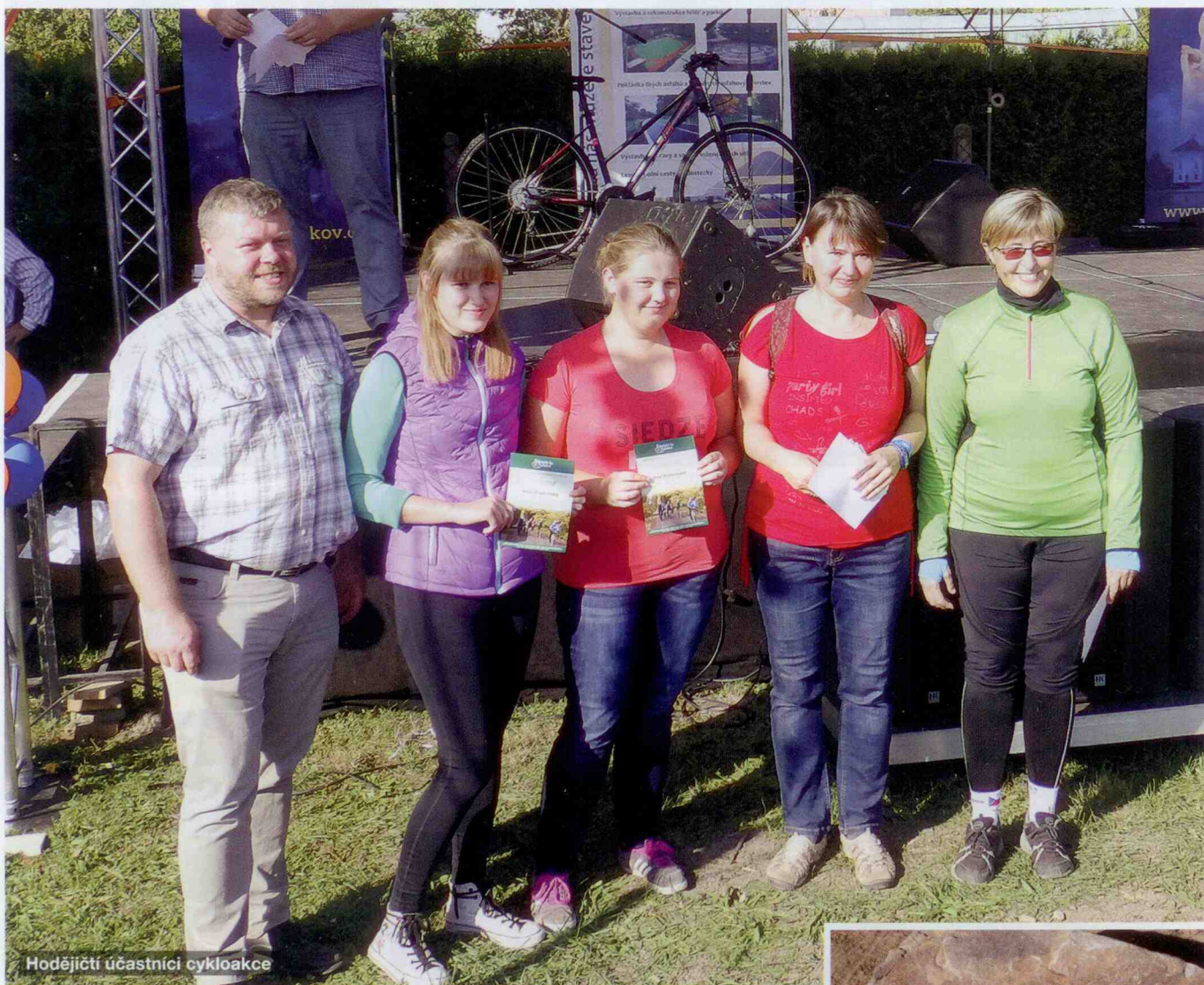
Hodějící účastníci cykloakce

Den 28. 9. bývá již několik let spojen s ukončením cykloakce Ždánického lesa a Politaví. Letošní rok se ukončení konalo ve Slavkově u příležitosti slavnostního otevření nové 2,5 km cyklostezky ze Slavkova u Brna do Hodějic. Na stavbu cyklostezky přispěla finančně i obec Hodějice částkou 200 tis. Kč. Po slavnostním přestřižení pásky jsme absolvovali spanilou jízdu a několik desítek cyklistů si tak mělo možnost projet trasu ze Slavkova do Hodějic