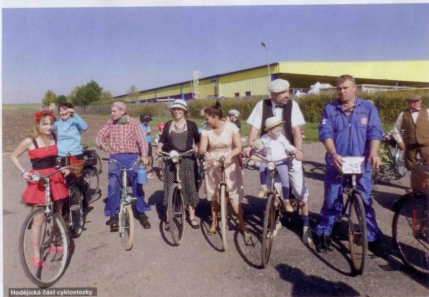
Hodějická část cyklostezky