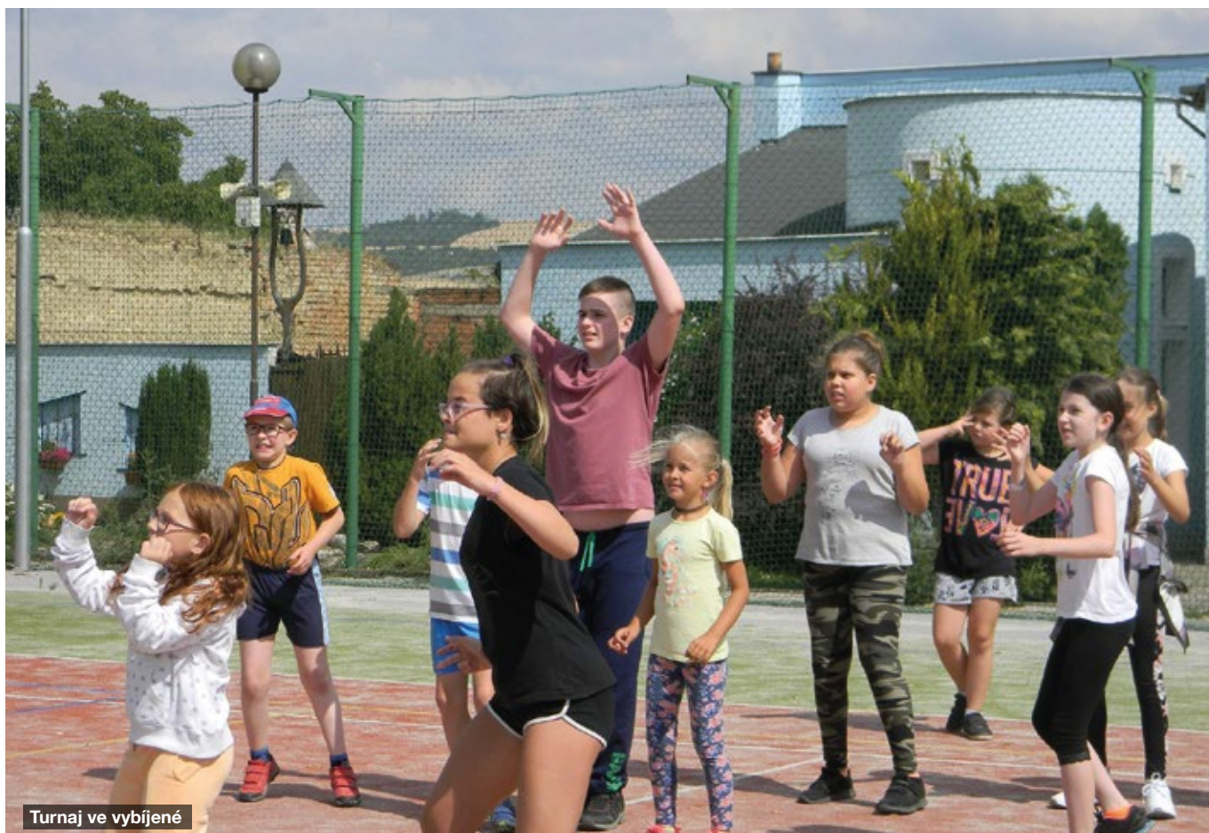
Turnaj ve vybíjené