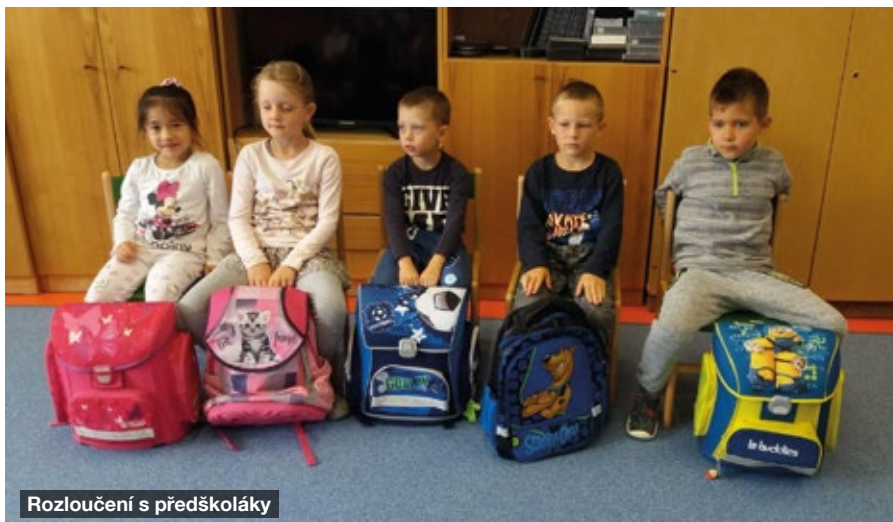
Rozloučení s předškoláky

Ocitli jsme se v kouzelném prostoru a připadali jsme si, jako bychom byli přímo pod hvězdnou oblohou, či na dně oceánu. Společně jsme poodhalili tajemství světa stromů, dozvěděli jsme se mnoho o fotosyntéze, oběhu kyslíku a struktuře stromů od kořenů až po listy.