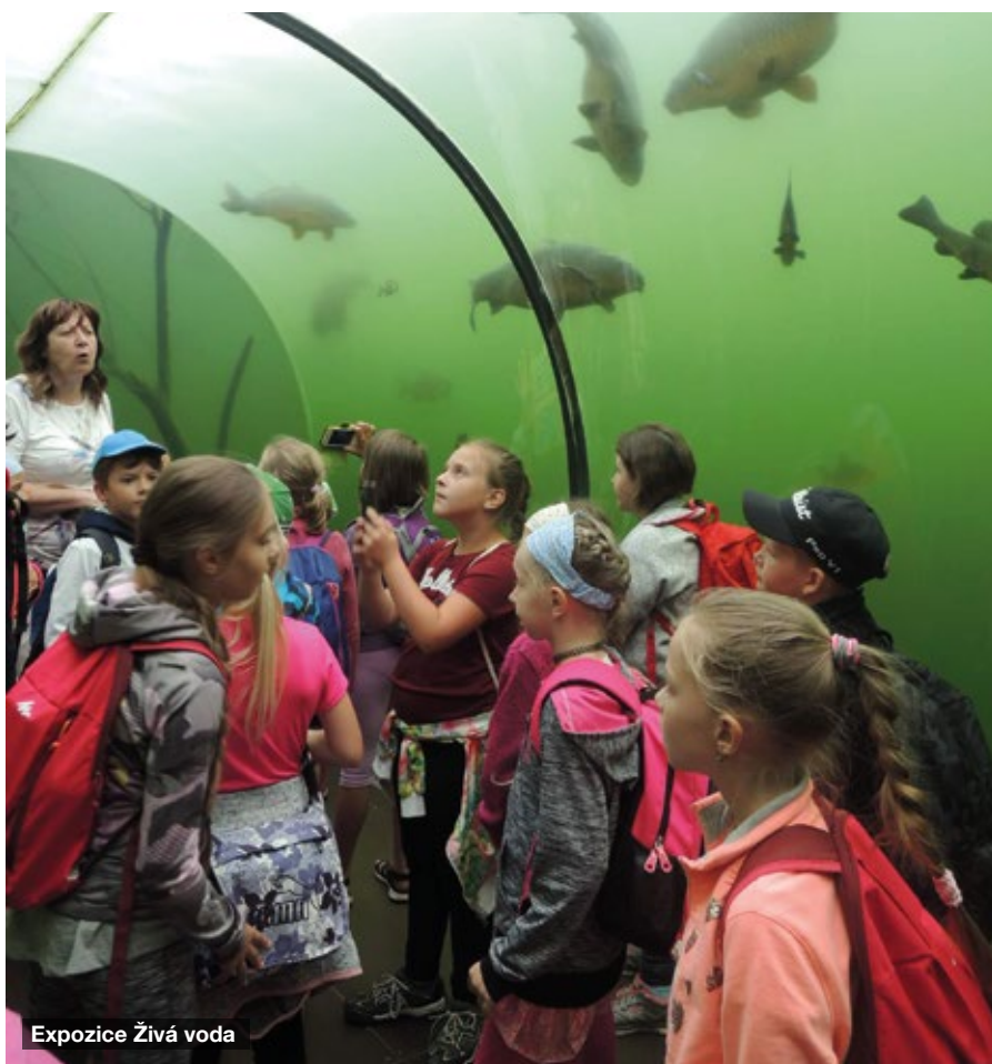
Expozice Živá voda

Děti se sice rozutekly na prázdniny, ale škola neosiřela. O prázdninách