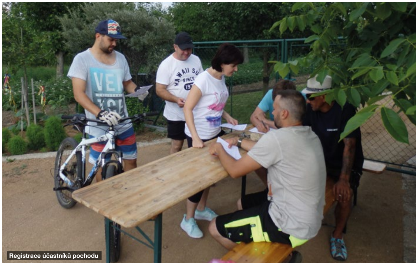
Registrace účastníků pochodu

Na 8. 6. 2018 připravila obec Hodějice pro příznivce zdravého pohybu obcí Křižanovice a Hodějice tradiční podve-