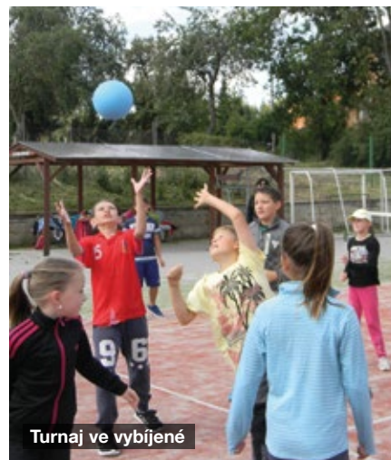
Turnaj ve vybíjené