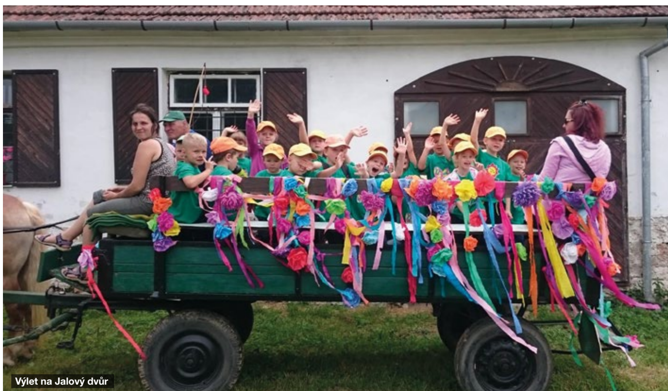
Výlet na Jalový dvůr