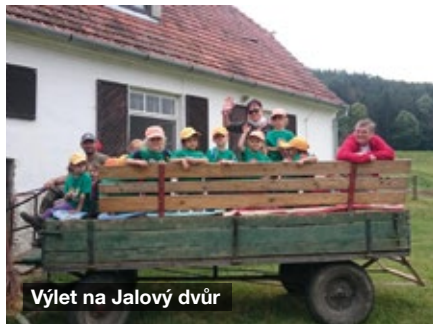
Výlet na Jalový dvůr