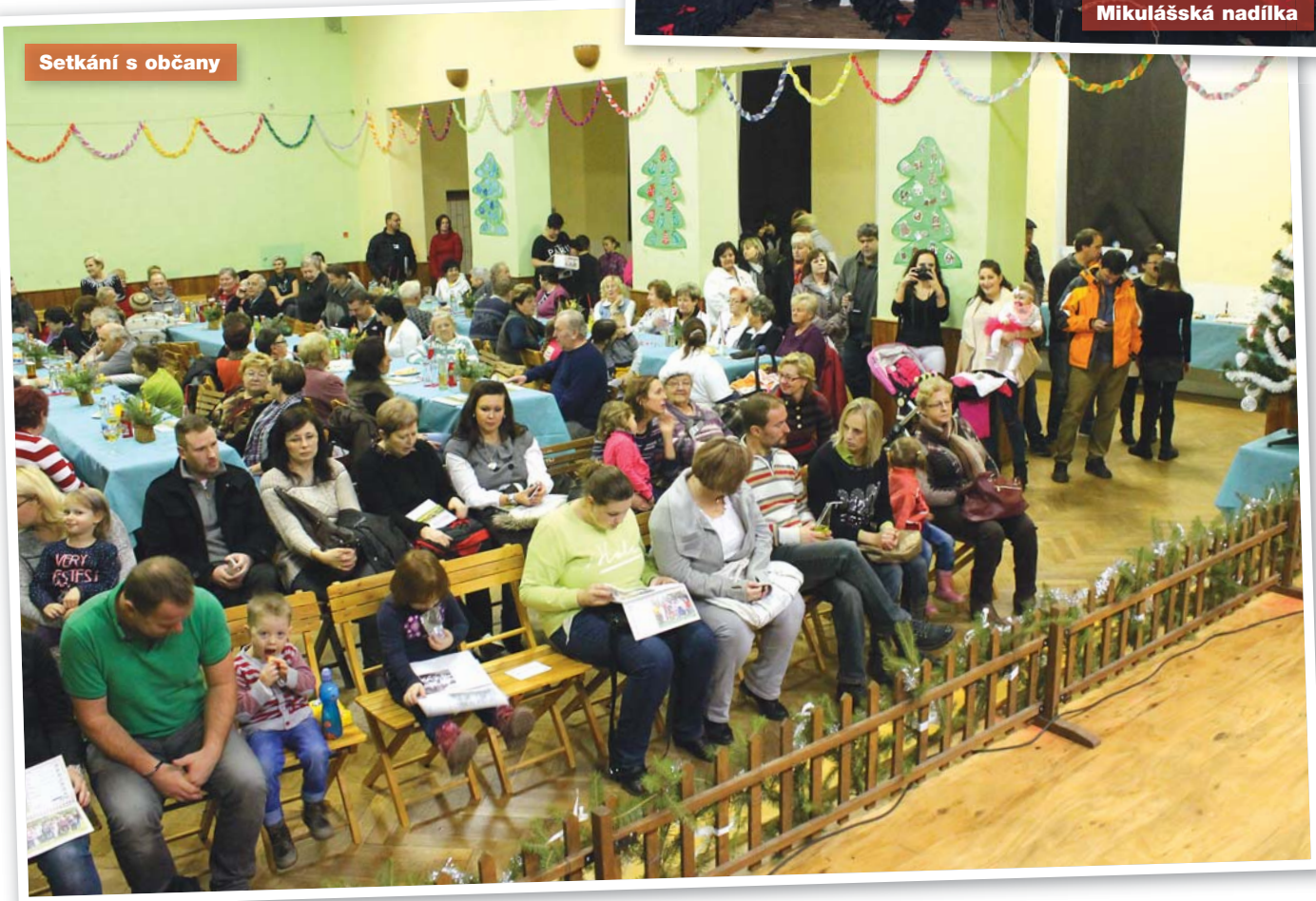
Setkání s občany