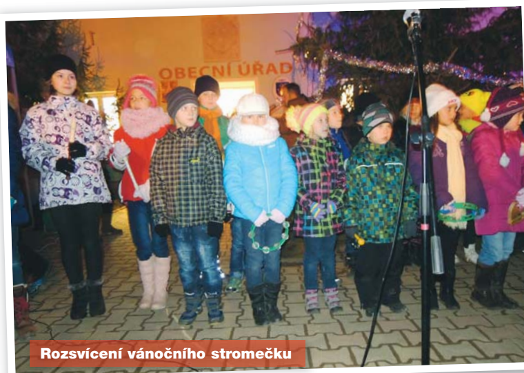
Rozsvícení vánočního stroměčku