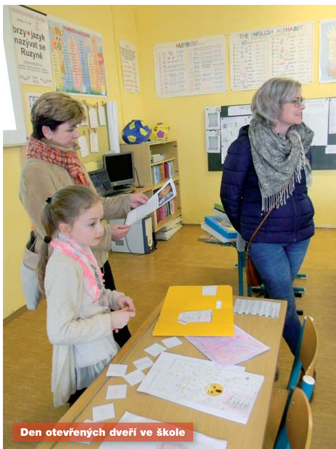
Den otevřených dveří ve škole