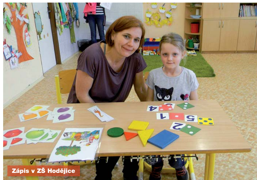
Zápis v ZŠ Hodějice