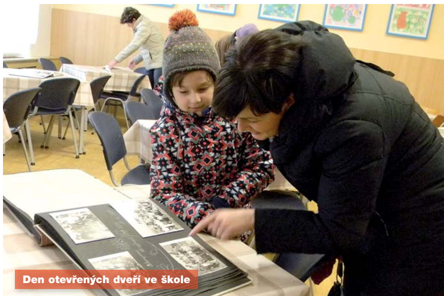
Den otevřených dveří ve škole

A potom už přijde červen, měsíc očekávání konce školy a předávání vysvědčení. Aby čas čekání na prázdniny uběhl dětem rychleji, uskutečníme ve škole ještě několik akcí: oslavu Dne dětí a školní výlet. Pro letošní výlet jsme vy-